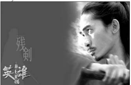
یادداشتی بر فیلم «قهرمان»