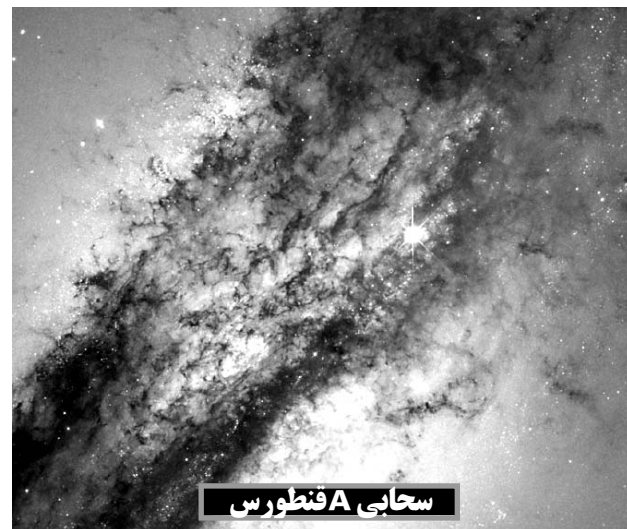
سحابی A فنطورس