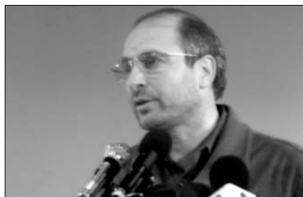
قالیباف در شریف:

... می گویند شریفی ها بی بخارند. بین بی بخاری و اعصاب داغون بی بخاری را انتخاب می کنم. پول را می دهم و می روم. حالا نوبت نگرانی است. هر چه می گردم کارتم را پیدا نمی کنم. راهم نمی دهند. باز هم بی بخاری را انتخاب می کنم و با کمال آرامش، اسم و شماره ی دانشجویی و اسم رییس دانشکده مان را می گویم تا مجوز ورود بگیرم. ... ■ صفحات ۴ و ۵