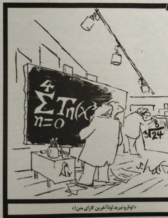
«اورادو نبرید او نا آخرین کارای من!»

ورفتن به اندازه کافی سریع است. این توانایی شاید امروز فقط به درد رفتن روی سکوی المپیک بیاید اما احتمالاً روزگاری به انسان‌های اولیه اجازه می‌داده است تا زودتر از حیواناتی مثل کفتارها و کرکس‌ها خودشان را به لاشه‌ی جانوران برسانند و غذایی بدست بیاورند. قبل از تیر و کمان، گذران زندگی بدون دویدن واقعا دشوار بوده است! این را لیبرمن می‌گوید.