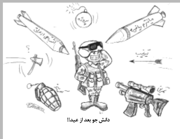
دانش جو بعد از عید!!